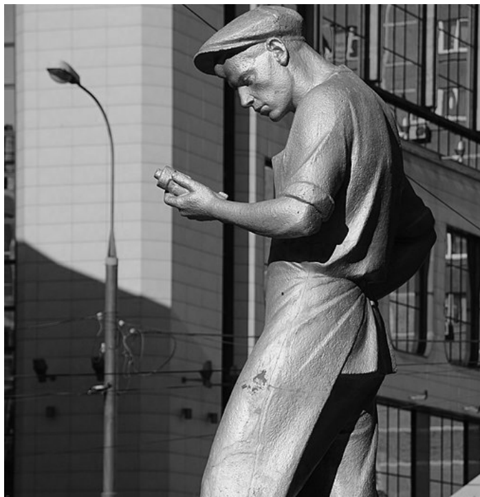
«Рабочий изобретатель» Адрес: пл.Крестьянская

Может показаться, что «Рабочий-изобретатель» — обычный памятник, заботливо поставленный советской властью. Но если присмотреться, то понимаешь, почему в народе его назвали «Человек с мобильником». Людей в той же позе, в какой стоит пролетарий, мы видим каждый день.