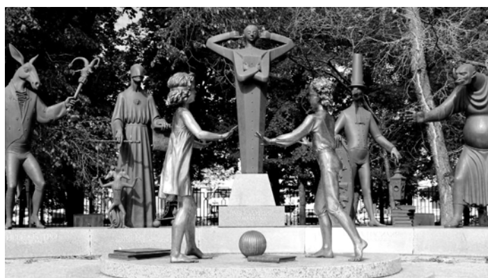
«Дети — жертвы пороков взрослых»

Трудно пройти мимо Аллеи Космонавтов на ВДНХ и не обратить внимание на памятник Солнечной системе. Его главная особенность — все планеты находятся в том же положении, в котором они были в день запуска первого советского спутника — 4 октября 1957 года. Особой точкой на Земле обозначен космодром Байконур, откуда стартовала ракета-носитель. В состав планет ради исторической справедливости оставлен Плутон.