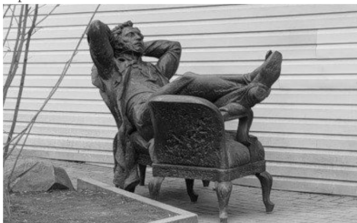
Памятник А.С. Пушкину Адрес: ул. Большая Молчановка, д.10.

Одна из самых неоднозначных, но интересных скульптурных композиций. Двух детей, играющих с завязанными глазами, окружают фигуры, олицетворяющие человеческие пороки. Автором стал скандально известный скульптор Михаил Шемякин — автор памятника Петру Первому в Петропавловской крепости.