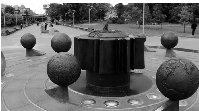
Памятник Солнечной системе Адрес: Проспект Мира, 111

Может показаться, что «Рабочий-изобретатель» — обычный памятник, заботливо поставленный советской властью. Но если присмотреться, то понимаешь, почему в народе его назвали «Человек с мобильником». Людей в той же позе, в какой стоит пролетарий, мы видим каждый день.